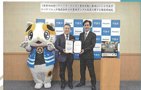
門真市とパナソニック(株)との寄附ボックス設置に関する協定締結式 (2022年2月1日)