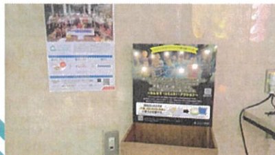
門真市民文化会館 ルミエールホール

大阪府門真市と「無電化地域へソーラーランタンを届ける公益活動の連携協定」を締結し、門真市役所や公民館などにリサイクルボックスを設置しています。